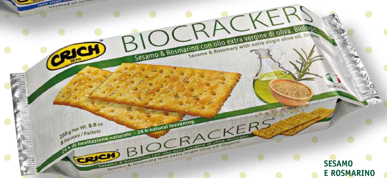
SESAMO E ROSMARINO