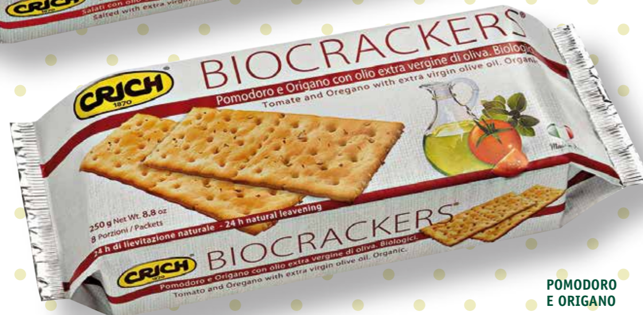
POMODORO E ORIGANO