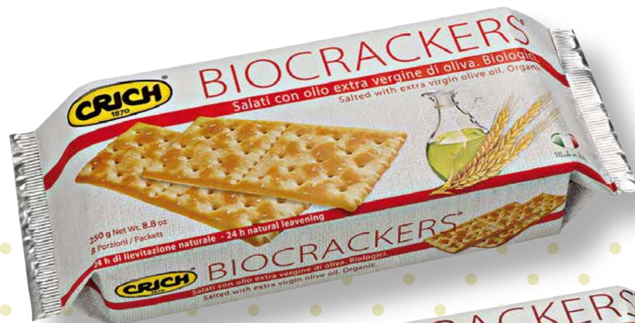
SALATI IN SUPERFICIE

SUOLO E SALUTE SRL OidC. autorizzato con DM MRAAF 9697232/30.12.96 in applicazione al Reg. CEE n. 2092/91 Prodotto da agricoltura biologica Regime di controllo CE