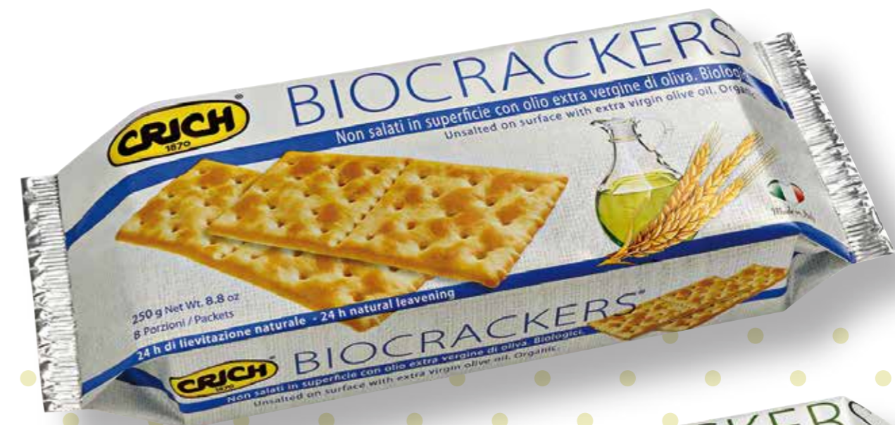
NON SALATI IN SUPERFICIE